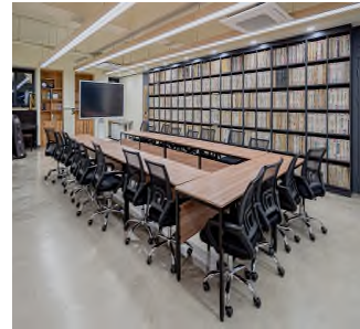
예술가 및 활동가 네트워크 및 지역 문화 거점 공간

다양한 독립문화예술가들과 함께 공연, 전시, 축제, 음반 제작 등 활동과 공공문화프로젝트, 마을만들기, 지역문화 정책 개발, 문화 예술 네트워크 형성하고 있는 문화예술단체 (사)인디053