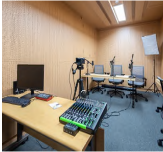
예술가 연습실 및 녹음실 스튜디오 제공