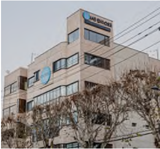
문화예술 공간 운영 '뜻밖의 건물'